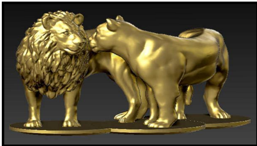
الشكل ١ يوضح نحت باستخدام تكنولوجيا ثلاثية لأبعاد

بعضها البعض حتى يكتمل الشكل المجسم المطلوب ،وان اهم ما يميز تقنية الطباعة الثلاثية الابعاد هو التخصص بمعنى انك تنسج كل شيء بالشكل الذي تريده و بالتعديل الذي يناسبك وباستخدام طريقة الطبقات الصغيرة ويمكن انتاج طرق متعددة لا يمكن انتاجها بالطرق التقليدية (١) ،