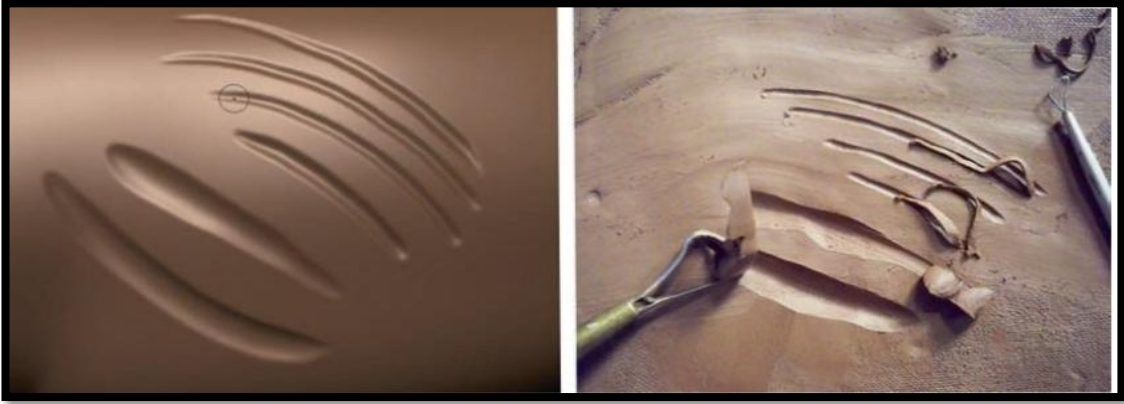
الشكل ١ يوضح ادوات النحت الرقمي

ان الادوات المتاحة في استوديو النحت الرقمي نجد مثلتها لدى برامج النحت الرقمي بكل انواعها فعلى سبيل المثال في برنامج mudbox يتم تسمية الادوات على سبيل وظيفتها وهذه الادوات يمكن تخصيصها عن طريق ضبط خصائصها مثل الحجم والقوة لأنشاء عدد لا يحصى من الادوات التي تقوم بمهام مختلفة ، فكل اداة موجوده في استوديو النحت التقليدي يوجد منها اداة أو ادوات في برامج النحت الرقمي من شأنها ان تخلق نفس التأثير وما شابه ، لكن لا يمكن انكار ان هناك اختلاف بين العمل في الطين الحقيقي والمضلعات لكن مع الممارسة فإن تلك الممارسات تتلاشى سريعا والنحت في تطبيقات النحت الرقمي يصبح طبيعة ثابتة (١) كما في الشكل (١)