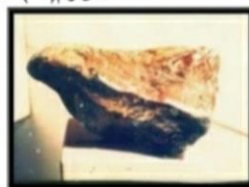
شكل رقم (٩٦)