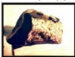
شكل رقم (٩٧)